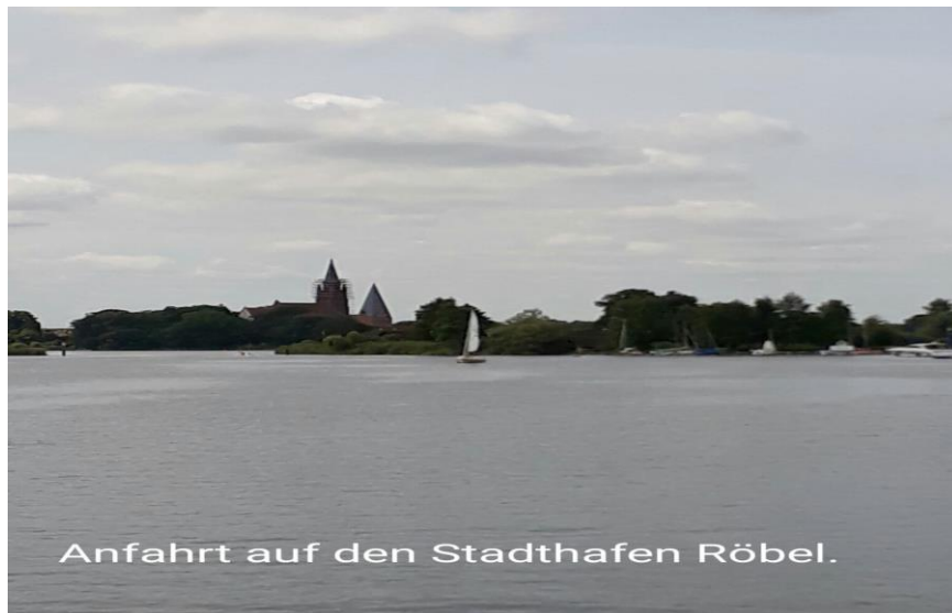
Stadthafen Röbel ist in Sicht