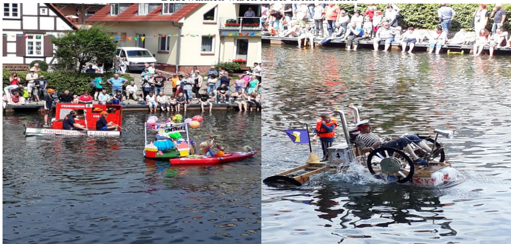
Badewannen waren leider nicht zusehen