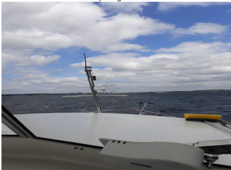
Überquerung Plauer See