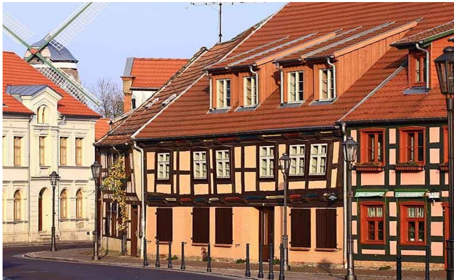
Altstadt von Röbel mit Windmühle