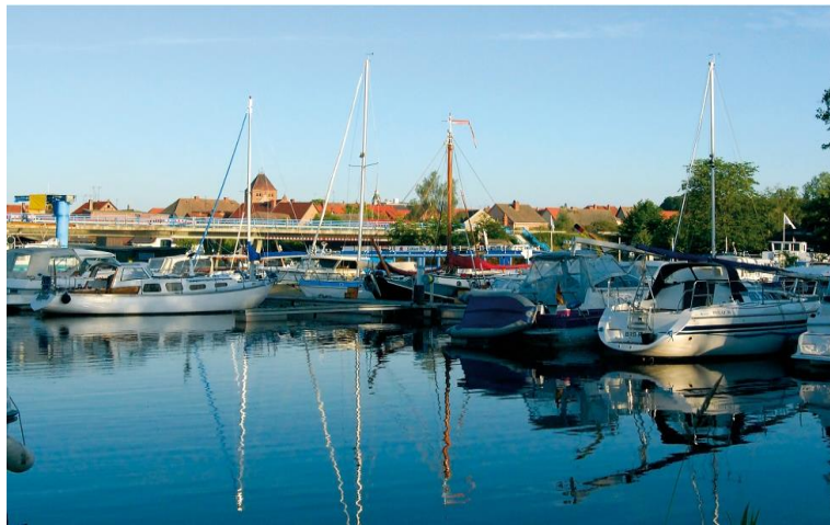
Hubbrücke Plau am See; hebt sich in Verbindung mit der Schleuse.