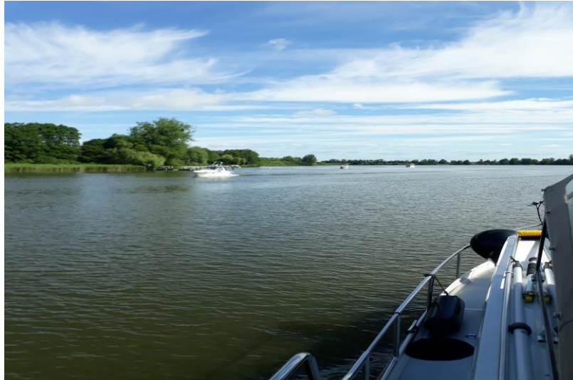
Müritzsee -mit Elde Durchfluss

Traumhaft schöne Revierfahrt, vorbei an wunderschönen Bootshäusern.