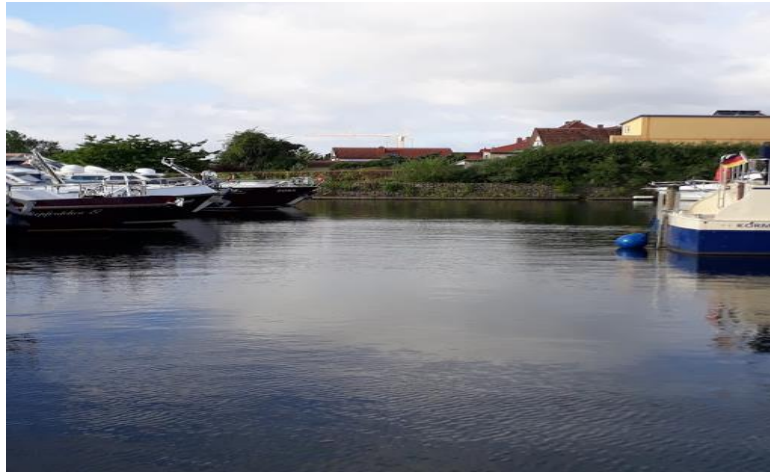
Stadthafen von Malchow

Um 18:00 h es regnete das erste mal. Aber der Regen war nur von kurzer Dauer und es klarte wieder auf.